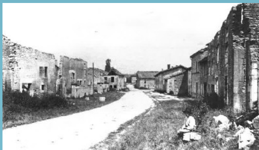
The main street of LUZY-SAINT-MARTIN in 1914 De hoofdstraat van Luzy-Saint-Martin in 1914