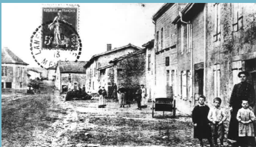
The main street of LUZY-SAINT-MARTIN in 1900 De hoofdstraat van Luzy-Saint-Martin in 1900