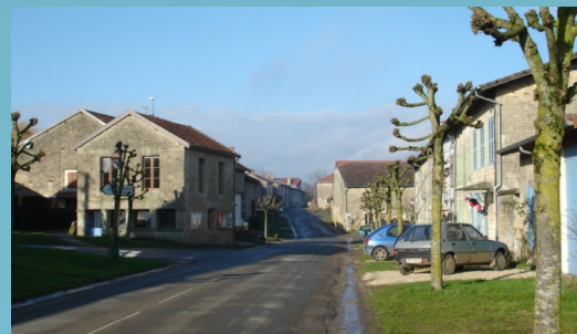
The main street of LUZY-SAINT-MARTIN in 2014 De hoofdstraat van Luzy-Saint-Martin in 2014